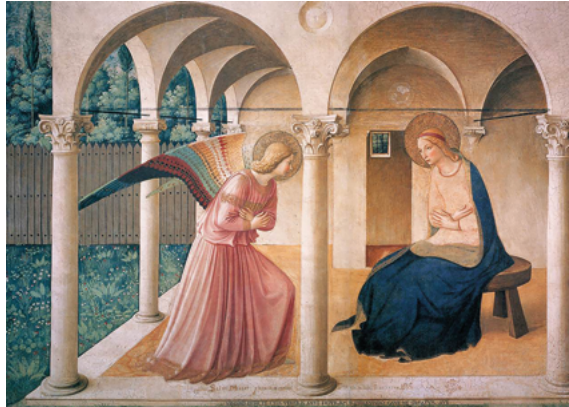
© Fra Angelico, l'Annonciation, couvent San Marco, Florence - domaine public

Qui que nous soyons, quels que soient notre âge, notre santé ou notre foi, nous sommes conviés et attendus pour cheminer ensemble pendant six jours à Lourdes.