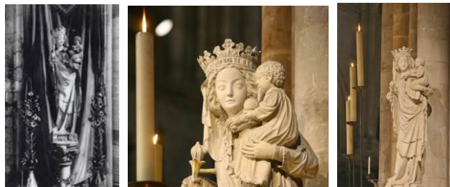
La Vierge à l'Enfant (Notre Dame de Paris)

La Vierge représentée sur les différentes médailles des Pèlerins et Hospitaliers du Diocèse de Paris est une représentation de la Vierge à l'Enfant.