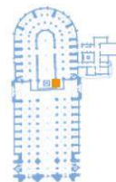
Pilier sud de la cathédrale Notre-Dame de Paris

Dans le chœur, adossée au pilier sud-est du transept, des fleurs toujours blanches honorent une Vierge à l'Enfant priée sous le vocable de « Notre Dame de Paris » . Dès les origines de la cathédrale au XII ème siècle, un autel dédié à la Vierge fut disposé à cet emplacement.